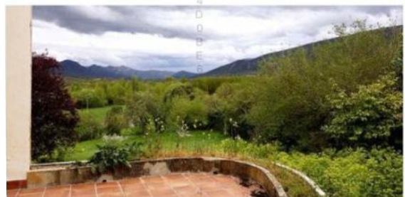
Las vistas desde la antigua casa del médico de Quintana de Valdivielso son espectaculares. / 08

La Junta de Castilla y León ha invertido 48.400 euros en acondicionar la casa del médico de Quintana de Valdivielso, que se alquilará por un máximo de 7 años